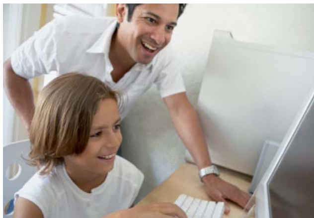
Die Kabel-TV-Dose ermöglicht ultraschnelles Surfen im Internet.

Um maximal vom Kabel-TV-Anschluss profitieren zu können, empfiehlt es sich für Hauseigentümer, die Hausverteilanlage auf dem neusten Stand zu halten. So ist garantiert, dass auch neue Dienste, wie zum Beispiel ultraschnelles Breitbandinternet und HDTV, einwandfrei funktionieren. Interessierte erhalten bei ihrem lokalen Kabel-TV-Anbieter weitere Informationen und eine kompetente Beratung.